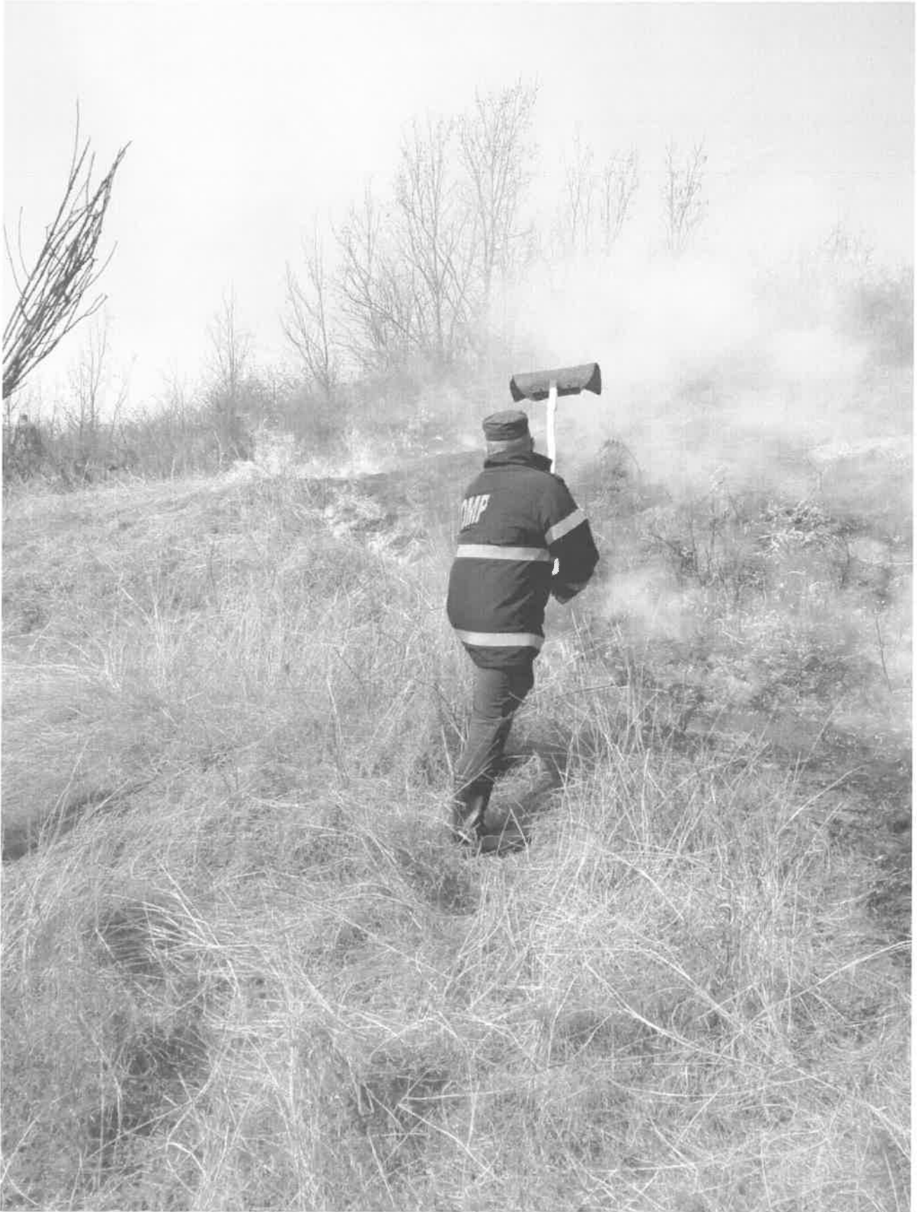
WhatsApp Image 2020-04-01 at 9.46.13 PM.jpeg