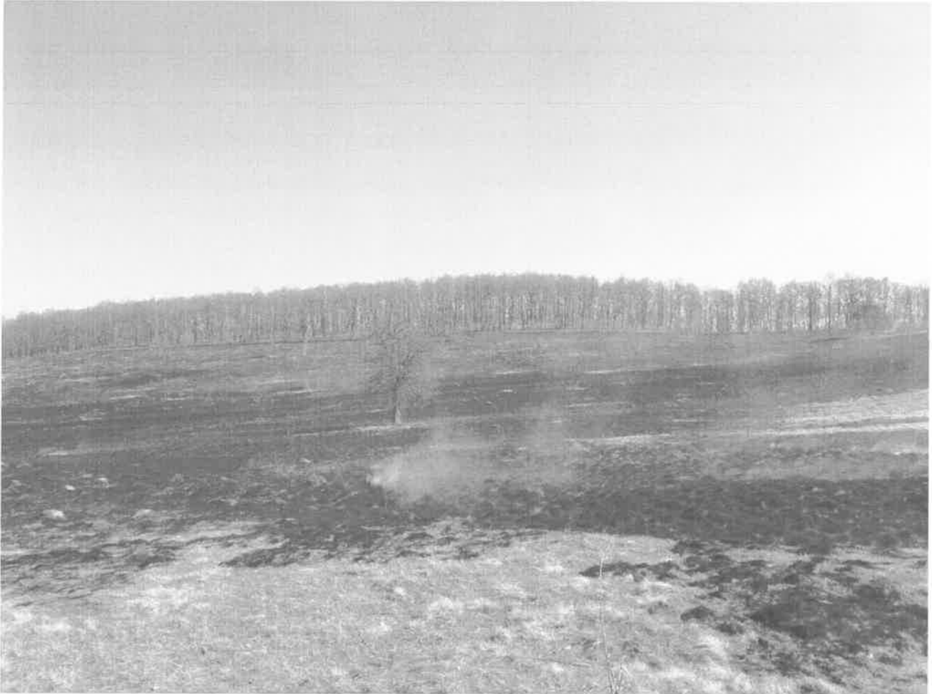
—WhatsApp Image 2020-04-07 at 10.15.41 PM.jpeg