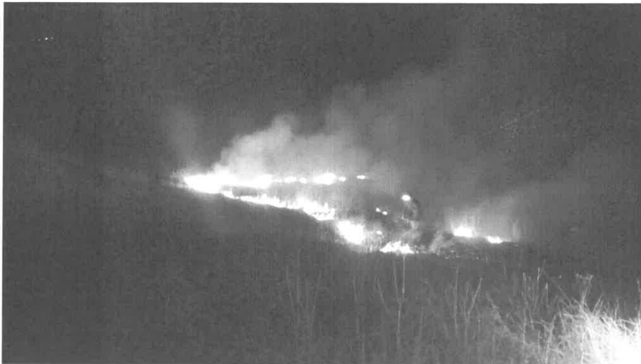
WhatsApp Image 2020-04-05 at 5.19.09 PM.jpeg