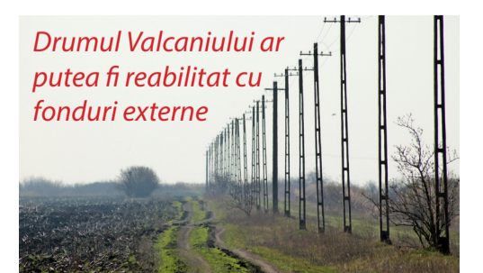
Drumul Valcaniului ar putea fi reabilitat cu fonduri externe

Fără drept de apel, ne gândim și la legătura cu Serbia. Dacă proiectele care sunt legate de Ungaria urmează să fie doar depuse și realizate, așa cum spuneam - până în 2018, acum ne îndreptăm atenția și spre Serbia deoarece dorim să scurtăm drumul cetățenilor de la Beba Veche până la Valcani, dorim să asfaltăm împreună cu Valcaniul, printr-o asociație intercomunitară, cei 20 km ce unesc cele două comune. Practic, orice cetățean va putea ajunge în 15-20 de minute la Valcani, la frontiera cu Serbia și de acolo mai departe, oriunde dorește în țara vecină. Acesta e un proiect pe care în acest an dorim să îl și depunem. (continuarea în pagina 3)