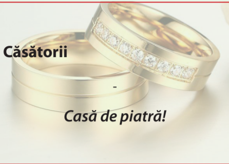
Casă de piatră!