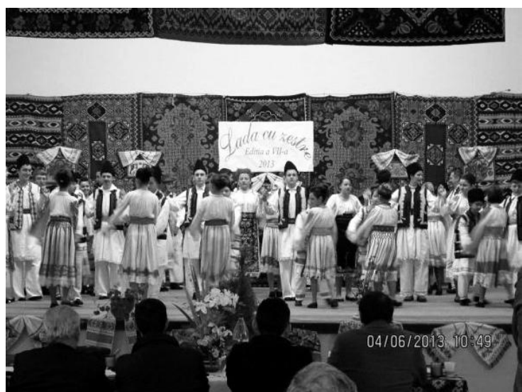
Imagini de la festivalul „Lada cu zestre”, ediția a VII-a, 2013, faza zonală, Boldur