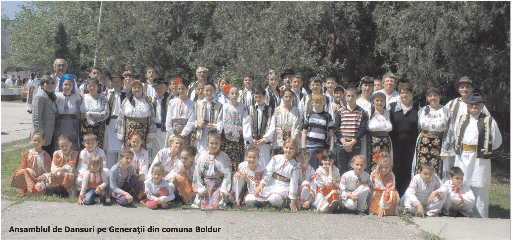
Ansamblul de Dansuri pe Generații din comuna Boldur