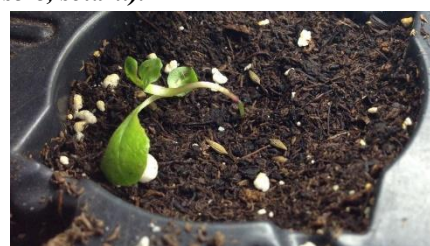
Căderea plănuțelor – Pythium debarianum