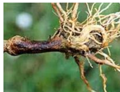
Mana la sol – Phytophthora parasitica

Mana la sol – Phytophthora parasitica afectează toate culturile de plante solanacee: tomate, ardei, vinete, etc. și cu precădere pe cele din spații protejate (sere, solarii). Mana la sol poate fi ușor confundată cu căderea plănuțelor ( Pythium ) doar că mana de sol afectează plantele în stadiu mai avansat de creștere (plante mai mari, peste 6 - 7 frunze). Boala este favorizată de monocultură. Ciuperca produce o brunificare a vârfului rădăcinii principale și a rădăcinilor secundare urmată de brunificarea bazei tulpinii, ofilirea și uscarea plantelor atacate. Plantele atacate se inmoaie și se subțiază în zona coletului. Tesuturile care sunt afectate vor devenii sfărâncioase din cauza putrezirii uscate. Phytophthora parasitica este favorizată în condiții de umiditate ridicată în sol și temperaturi peste 18°C, fertilizare excesivă cu azot și terenuri grele fara drenaj. Dacă gradul de umiditate este ridicat, la baza tulpinii afectate se va forma un puf de culoare albă.