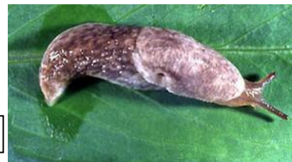
Limaxul cenușiu – Agriolimax agreste / Deroceras agreste

Limaxul cenușiu – Agriolimax agreste / Deroceras agreste este un dăunător nocturn, ziua stând retras sub frunze, bulgări de pământ etc. Se hrănește cu diferita specii de plante cultivate și spontane. Atacul lor se recunoaște după urma argintie de mucus lăsată de piciorul muscular cu care se deplasează. Atacul limacșilor reduce vigoarea plantelor prin roaderea rădăcinilor, a tulpinilor tinere, a frunzelor și a mugurilor.