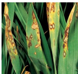
Rincosporioza- Rhynchosporium secalis