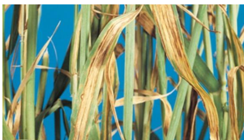
Sfâșiarea frunzelor - Pyrenophora graminearum