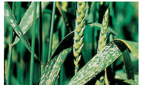
Rugina galbenă Puccinia striiformis Rugina brună, Puccinia recondita Rugina neagră Puccinia graminis Fainarea – Blumeria graminis

Rugina neagră denumită și rugina paiului sau rugina liniară. Este cunoscută în toate regiunile de cultură a grâului. Este mai puțin frecventă. Apare mai târziu decât celelalte două rugini, sub forma unor pustule de formă liniară, pulverulente, brun-negricioase pe toate organele aeriene ale plantei.