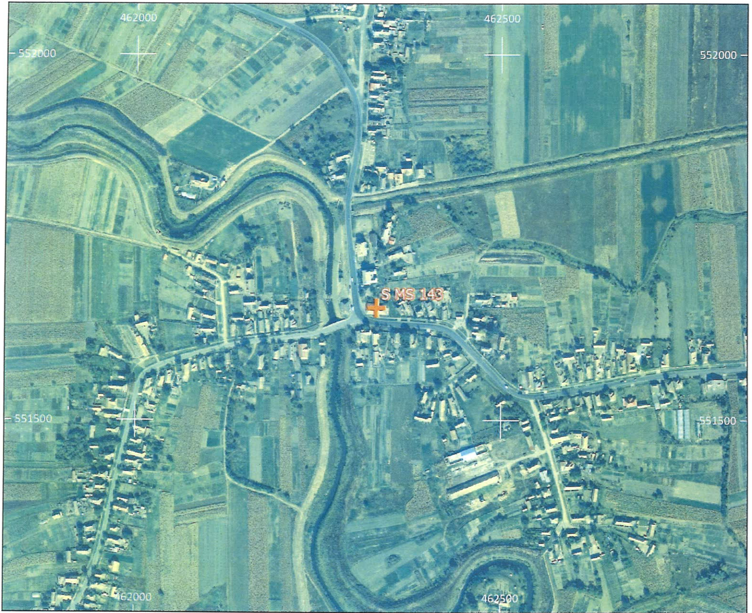
Amplasament sirenă - Faza HCL