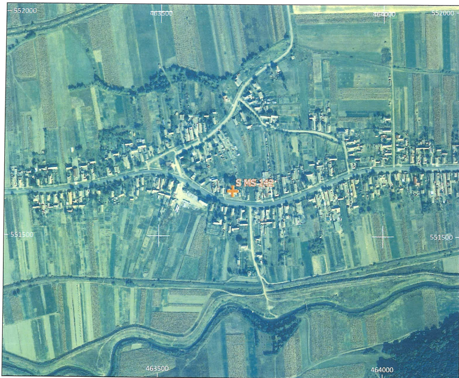
Amplasament sirenă - Faza HCL